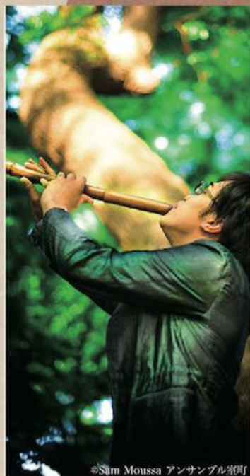
アンサンブル室町